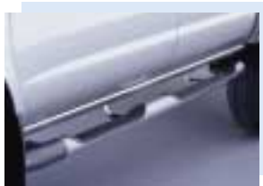
Atractivo escalón lateral del tipo tubular Attractive tube-type side step