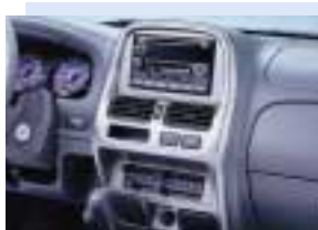
Conjunto de instrumentos central con terminación de color plateado metálico Center cluster with silver metallic finish

Asientos tapizados con género rústico doble Double-russel cloth upholstery seats